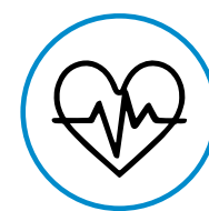
Seguro de Salud