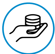
Ahorro para la jubilación